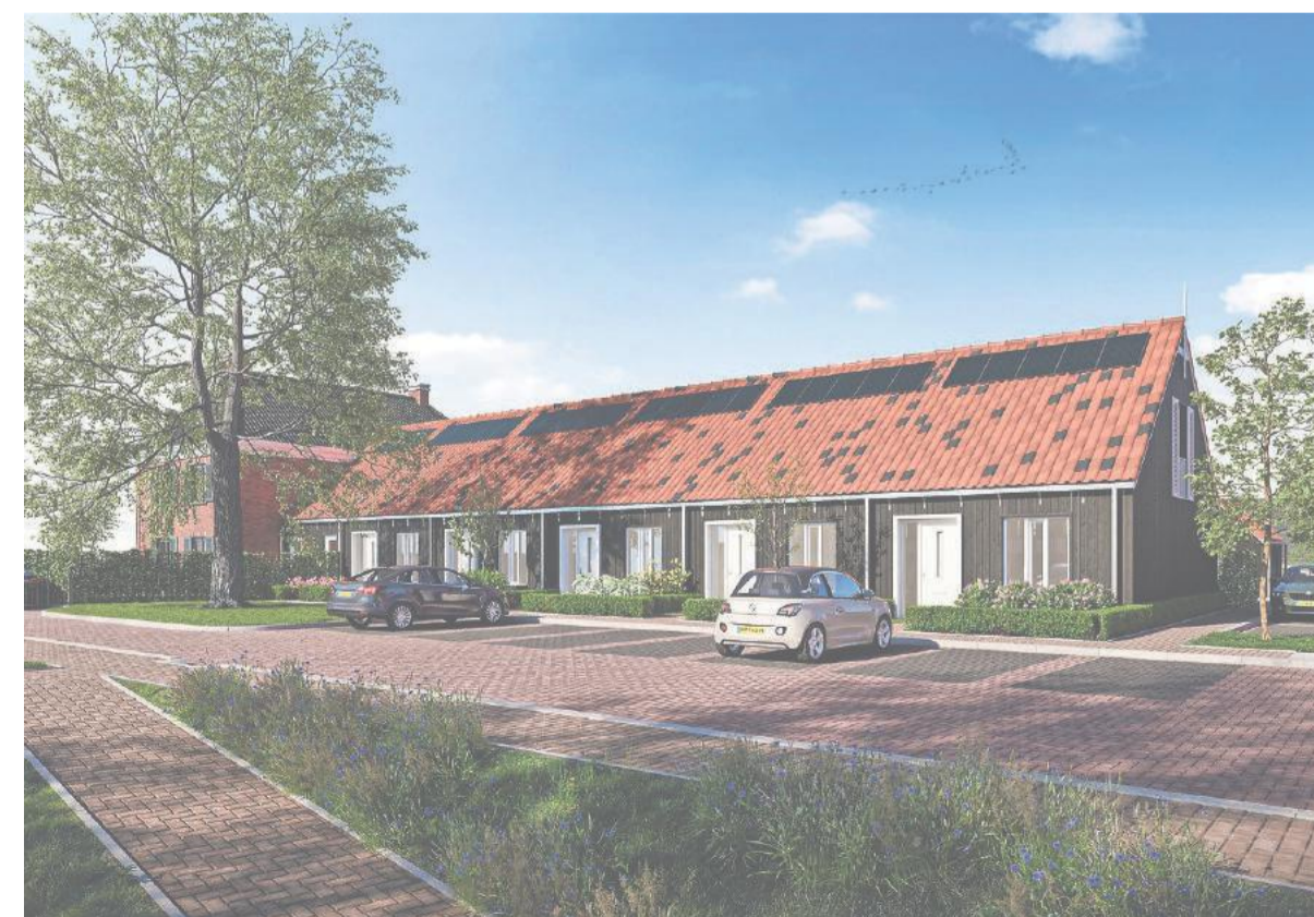
De wijk krijgt een uitstraling van een boerenhof.

Er is behoefte aan deze manier van wonen