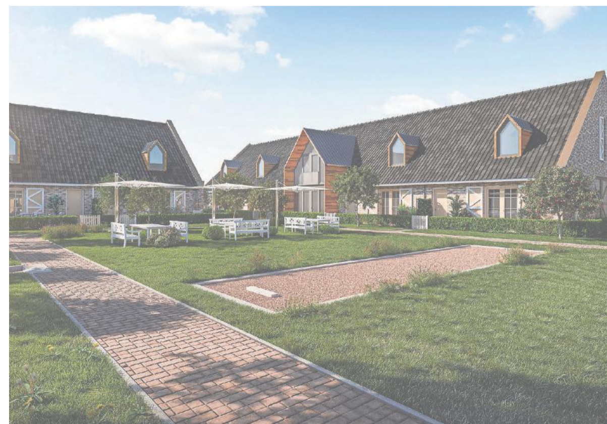
Bewoners zullen gezamenlijk allerlei voorzieningen delen, zoals moestuinen.

Er moest wat anders gebeuren met dit gebied